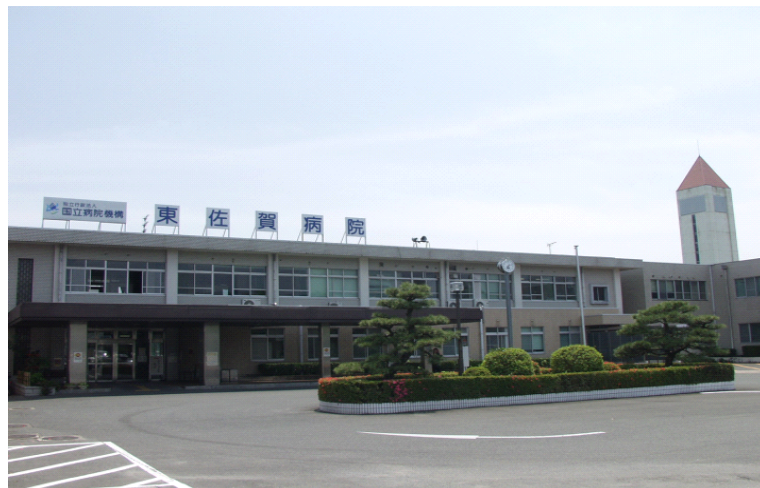
東佐賀病院 正面玄関