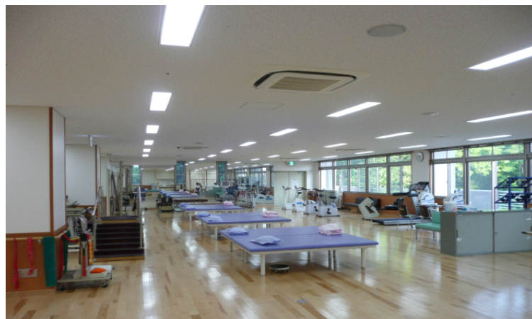
広々したリハビリ室