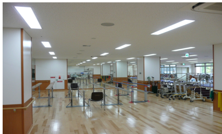
充実したリハビリ機器